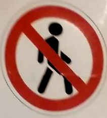
Движение пешеходов запрещено