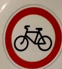
Движение на велосипедах запрещено