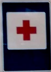
Пункт первой помощи