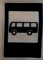
Место остановки автобуса и (или) троллейбуса